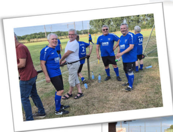
Die Gastmannschaft beim „Durchstöbern“ des TuS - ECHO